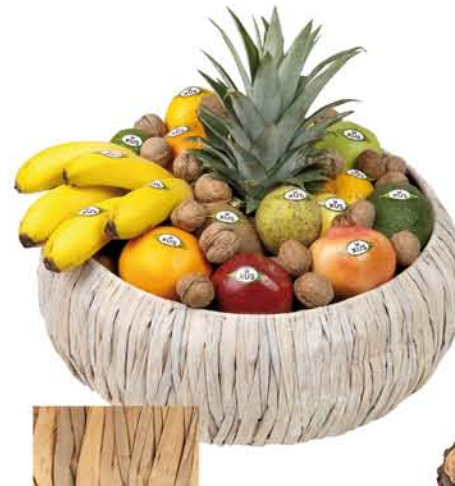
▲ Lot 4 CISTELLA BAMBU Pinya, taronges, limes, pomes, kiwis, plàtans, limes, peres, alvocats, magranes, nous i mandarines. Cistella disponible en dos colors