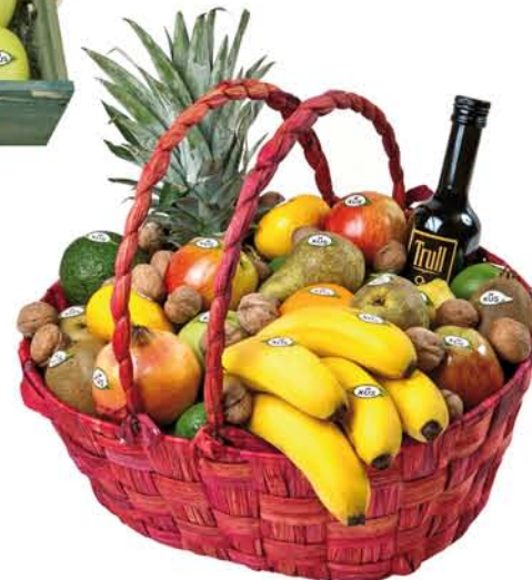
▲ Lot 3 CISTELL Pinya, magranes, alvocats, kiwis, limes, pomes, peres, plàtans, mandarines, taronges, limes, nous i oli verge extra.