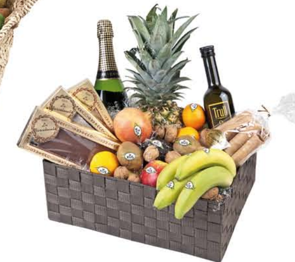
▲ Lot 9 CAPSA NYLON FOSC Taronges, mandarines, kiwis, peres, pomes, plàtans, pinya, magranes, limes, alvocats, xirimioies, nous, neules, torrò de xixona, torrò de alacant, torrò de xocolata, cava i oli verge extra.