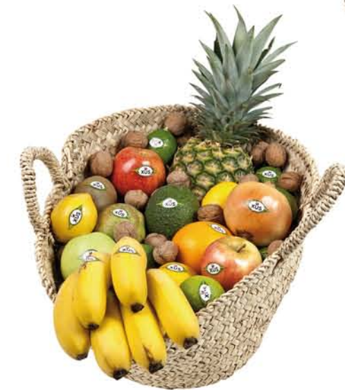
▲ Lot 7 CABÀS PETIT Pinya, taronges, pomes, peres, plàtans, mandarines, kiwis, limes, alvocats, magranes, limes i nous