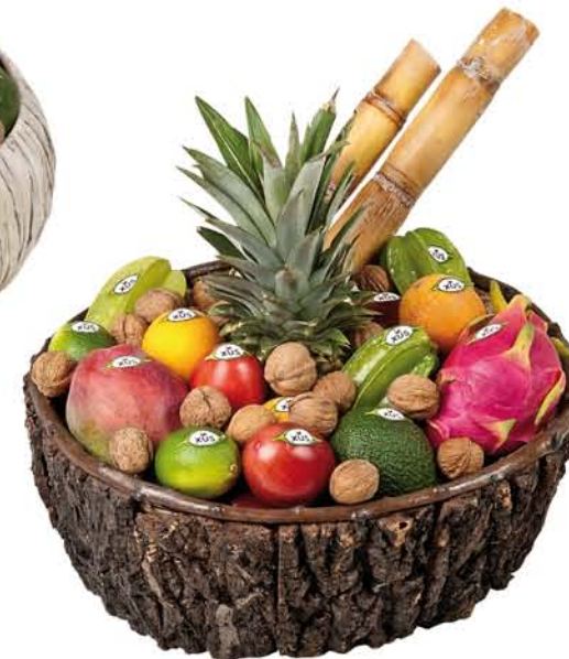
▲ Lot 5 PANERA TROPICAL Canyes de sucre, caramboles, pithaya vermella, granadilla, tamarillo, pinya, limes, mango, alvocats, magranes i nous