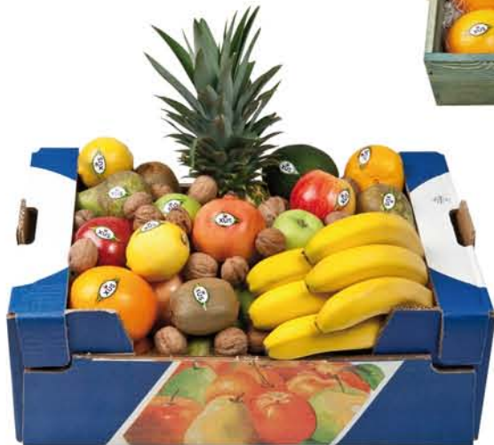
▲ Lot 1 CAPSA DE CARTRÓ Plàtans, pomes, taronges, mandarines, kiwis, peres, limes, magranes, alvocats, pinya i nous