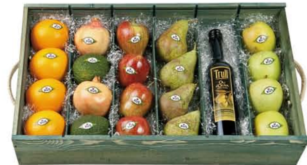
▲ Lot 2 CAIXA DE FUSTA Taronges, magranes, alvocats, pomes, peres i oli verge extra.