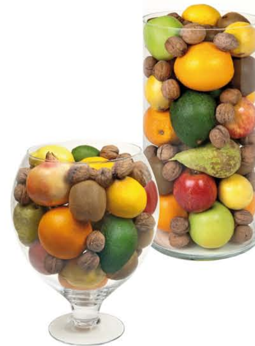
▲ Lot 6 COPA/ GERRO VIDRE Taronges, pomes, peres, limes, mandarines, kiwis, nous, alvocats, magranes. Disponible en Copa o en Gerro.