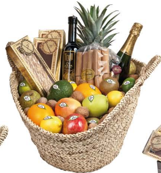
▲ Lot 8 CABÀS GRAN Pinya, taronges, pomes, peres, mandarines, kiwis, limes, alvocats, magranes, limes, nous, neules, torrò de xixona, torrò de xocolata, torrò d'alacant, cava i oli verge extra.